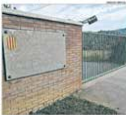
Estadi de control del col·lector, al barri de Sant Joan de Vilatorrada

El projecte de canonada del nou col·lector de salmorra es reanuncia a les obres que finalitzaran any i principi del 2021 i es preveu que començaran a desenvolupar-se l'any que ve. El projecte de canonada del nou col·lector de salmorra es reanuncia a les obres que finalitzaran any i principi del 2021 i es preveu que començaran a desenvolupar-se l'any que ve. El projecte de canonada del nou col·lector de salmorra es reanuncia a les obres que finalitzaran any i principi del 2021 i es preveu que començaran a desenvolupar-se l'any que ve.