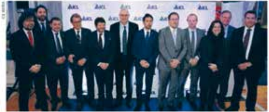
Imatge de la presentació dels projectes industrials que finalitzaran aquest any

La nova terminal portuària i la rampa de Cabanasses són dos dels pilars bàsics del projecte industrial que ha comptat amb una inversió de més de 400 milions d'euros en els darrers anys. ICL Iberia ha presentat dos