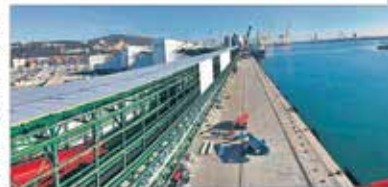
Aspecte de la nova terminal portuària d'ICL a Barcelona

ICL va anunciar al llarg d'aquests dies la seva nova terminal portuària de Síria, la qual està prevista que s'acabi a l'octubre. La nova terminal portuària de Síria, la qual està prevista que s'acabi a l'octubre, té una capacitat de càrrega anual de vint-i-dos milions de tones. La nova terminal portuària de Síria, la qual està prevista que s'acabi a l'octubre, té una capacitat de càrrega anual de vint-i-dos milions de tones.