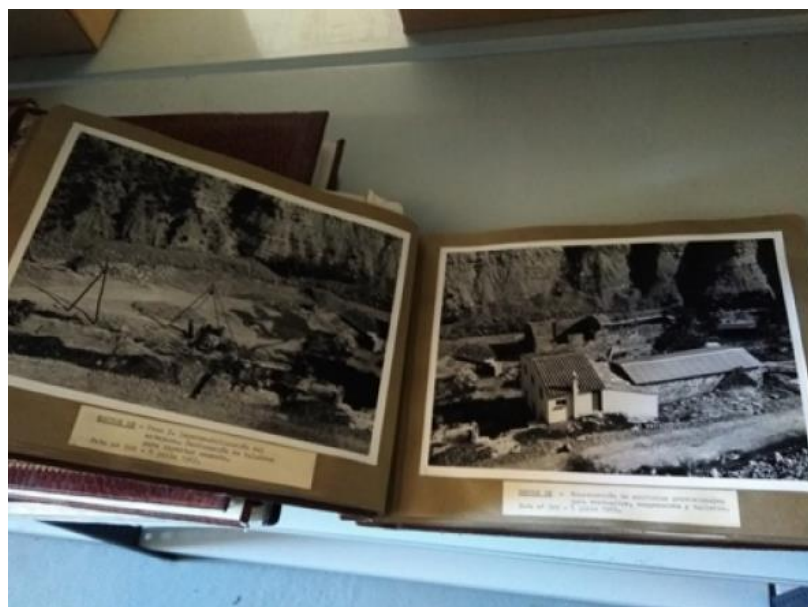
L'Arxiu històric digital d'ICL Iberia, en marxa

El nou equipament ha millorat les condicions ambientals de les obres de construcció de la rampa, garantint el treball als dos fronts d'excavació a la vegada, a banda de les tasques d'obra civil i muntatges mecànics i elèctrics per a la implantació de les cintes transportadores al llarg del seu traçat. La infraestructura instal·lada permet treballar amb l'aportació de més aire al túnel i amb les garanties de fer-ho generant el mínim soroll ambiental.