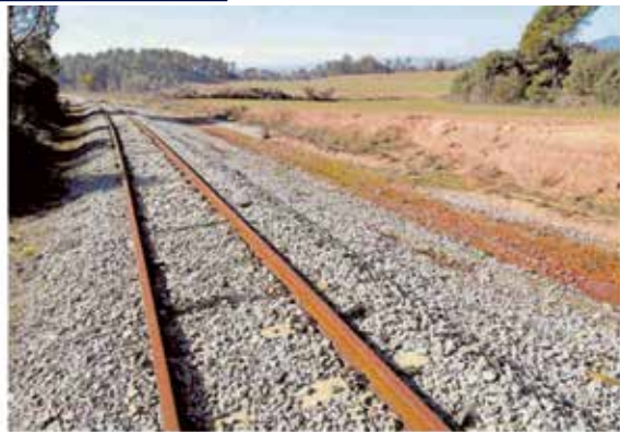
Zona agrícola, mirant cap a Santpedor venint de Sallent per la línia per on circularà l'Ecorail