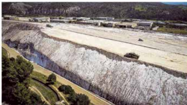
Part superior del ramal de la Botjosa, amb maquinària treballant, i que mostra el material que ja se n'ha extret