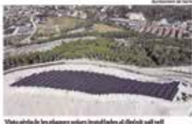
Vista aèria de les plaques solars instal·lades al dipòsit salí

L'ajuntament de Súria ha ben-eficaciat el nou parc solar de 25 MW d'energia fotovoltaica que cobrirà les necessitats de tot l'enllumenat públic i dels equipaments municipals durant prop de 25 anys.