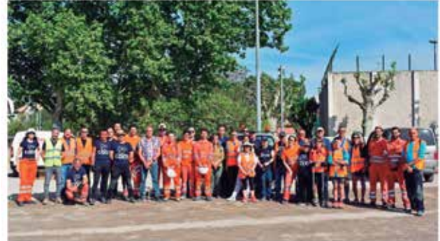
Foto de grup de les persones participants en la jornada de neteja de l'entorn a Súria

L'acció va tenir lloc el passat divendres dins de la Setmana Europea de la Prevenció de Residus