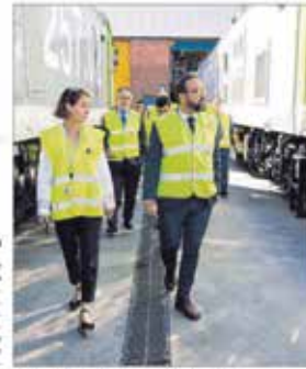
El conseller de Territori, Aïll i Paratubats, a Martorell

La introducció del dièsel està sent molt més eficient i potent, ha dit el conseller de Territori, Aïll i Paratubats, en l'acte de presentació d'una línia mixta de gasoil i elèctric