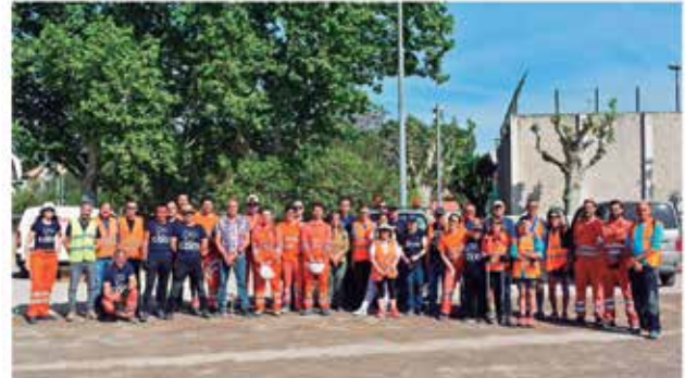
Foto de grup de les persones participants en la jornada de neteja de l'entorn a Súrria

L'acció va tenir lloc el passat divendres dins de la Setmana Europea de la Prevenció de Residus